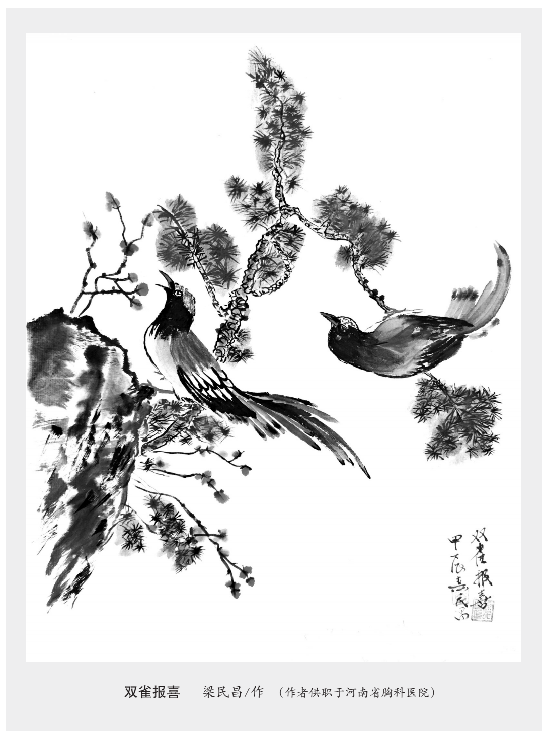
双雀报喜 梁民昌/作 （作者供职于河南省胸科医院）